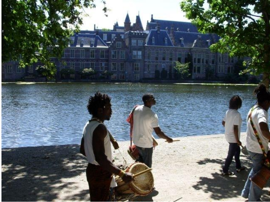
In front of Dutch Parliament, The Hague